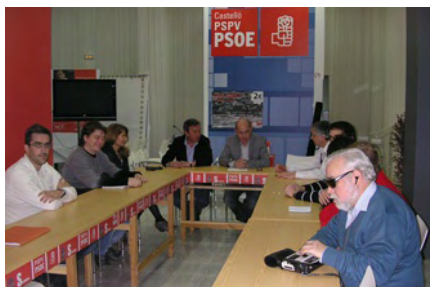
Reunión del plenario de Castellón.

Desde ahora, la OSSIC cuenta con miembros natos en el Comité Nacional del PSPV-PSOE y en los tres Comité Provinciales, por lo que nuestros posicionamientos políticos respecto a todos los temas relacionados con la Sociedad de la Información y el Conocimiento se oirán con voz propia